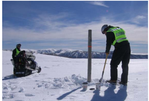
Control Invernal de Zorros, Parque Nacional Alpine, Australia

grupos de interés. Son Policías, vigilan la conducta de los visitantes para que respeten las normas del área. Son los trabajadores, los especialistas en la tecnología informática, los jefes de oficinas y los administradores.